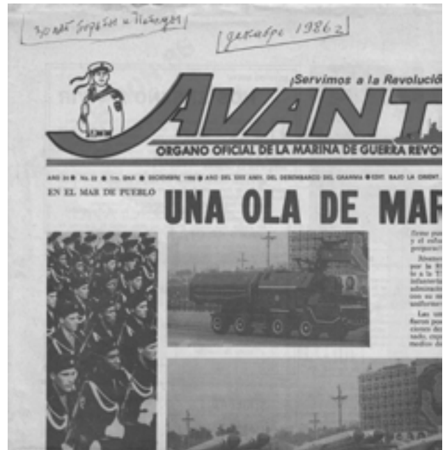
Морская пехота Кубы на первом параде в Гаване