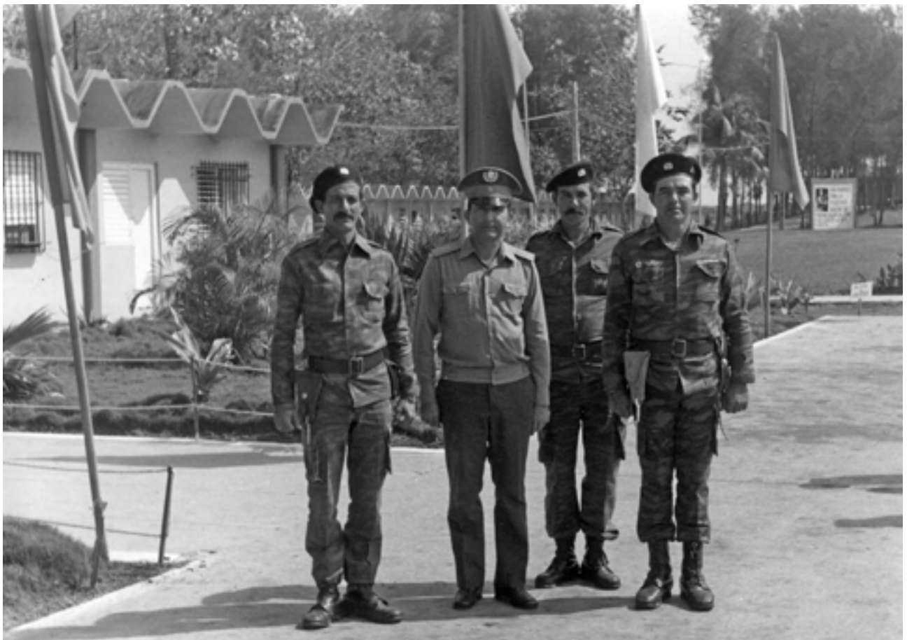
Начальник Генштаба Вооруженных Сил Кубы Улиес Росалес дель Торо с командованием полка морской пехоты

сте с ним мы принимали участие в отправке боевой и другой техники и боеприпасов в Анголу. Месяцев через восемь он был назначен на должность командира радиотехнического батальона. Замена неравнозначная, но приказы не обсуждают, особенно на Кубе.